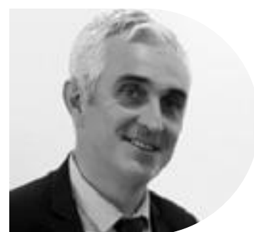
Par Gaël Brenaut, Président