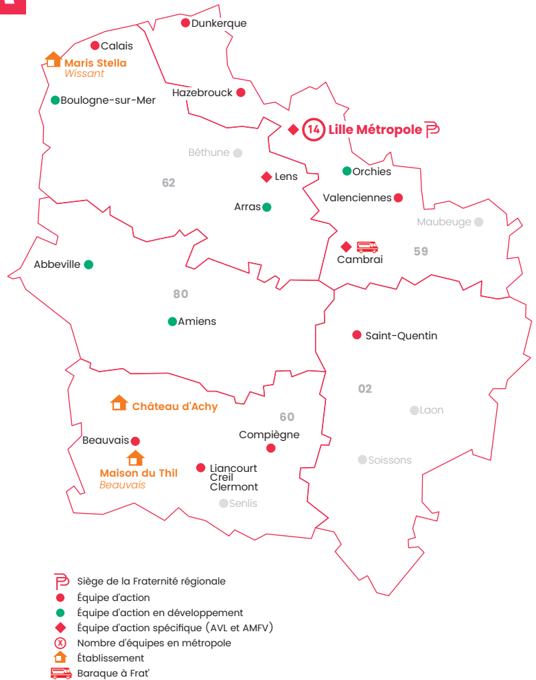
42 logements individuels dans la région

Grâce à l'engagement de ses bénévoles et à la collaboration avec les acteurs locaux, la Fraternité a développé des actions innovantes et adaptées, favorisant ainsi le maintien du lien social et l'amélioration de la qualité de vie des plus démunis. Ces efforts constants témoignent de notre engagement à lutter contre la solitude et l'isolement.